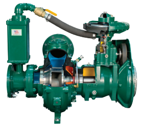
Configuración típica de la bomba