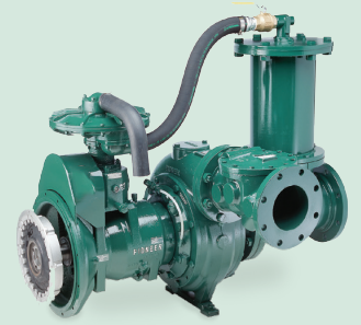
Configuración típica de la bomba